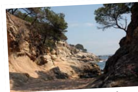
FELSENSTRAND IN PLAYA DE ARO